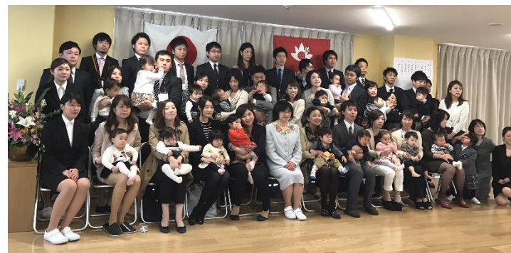
姪浜もみじの森保育園 第1回入園式を終え笑顔